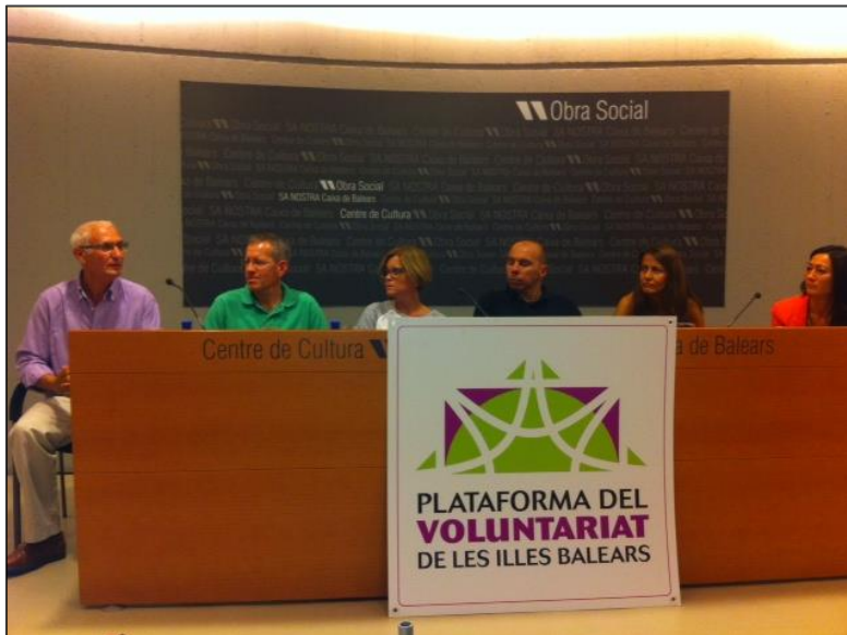
Taula rodona Voluntariat esportiu